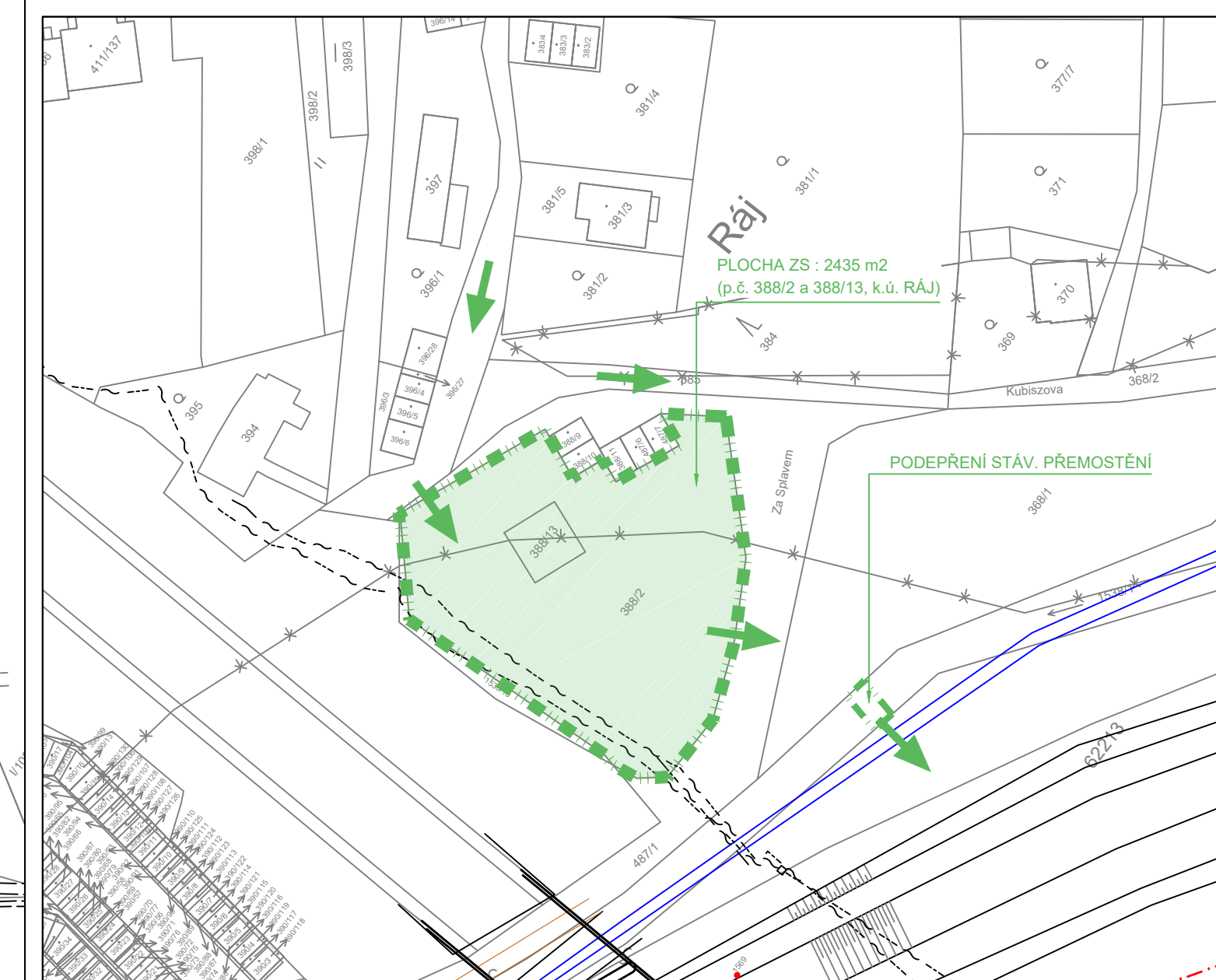
VÝŘEZ SITUACE PRO PARCELY ZAŘ. STAVENIŠTĚ A PODEPŘENÍ MOSTKU